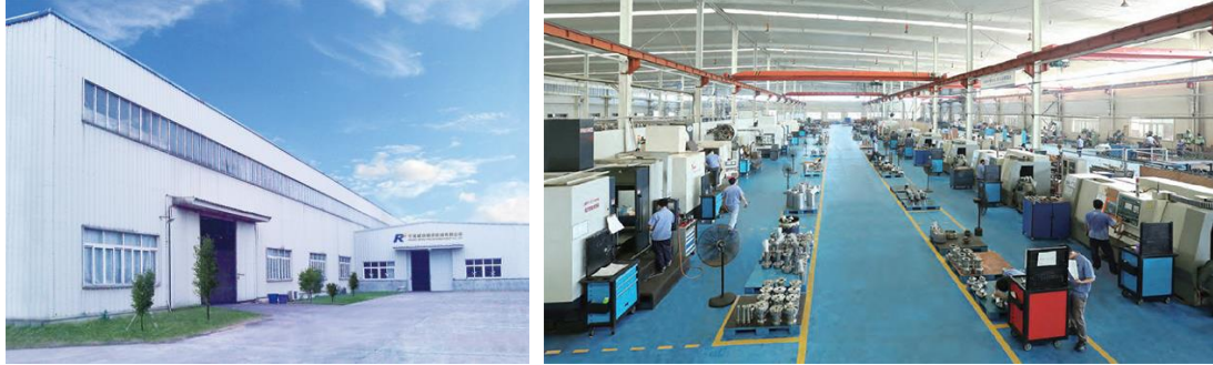
图 1 宁波威瑞

宁波威瑞精密机械有限公司是一家专业制造高精密注塑机用溶胶料管螺杆的制造商。本公司是由东南亚最大的台湾某双合金料管制造公司分离在宁波组建而成。公司成员由原公司总经理及技术骨干优化组合而成，具有先进的设计理念和多年的制造经验，在摒弃原来缺点的基础上制造出注塑机的“心脏”-一机筒和螺杆始终处于亚洲领先水准。