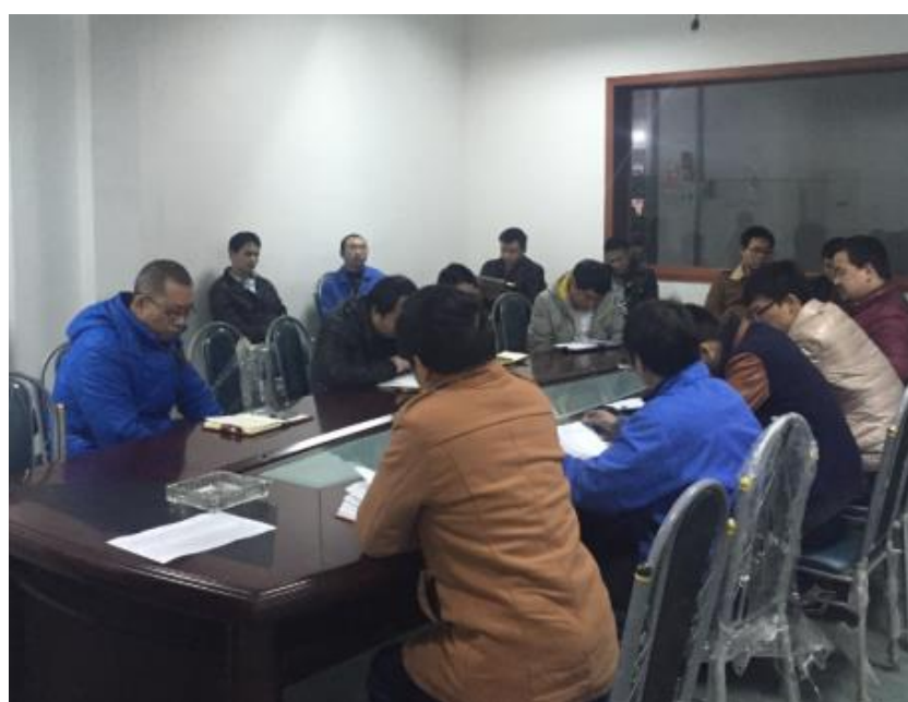
图 3 QC 小组质量改善会议现场培训活动

为牢固树立全体员工的诚信意识，公司每年年初制定本年度的质量诚信教育培训计划。实行三级质量诚信教育培训。由公司组织一级教育工作。各部门负责人部根据公司要求，编制教育培训计划和内容，认真组织下属的教育培训。各车间主任负责班组长及员工的诚信宣传教育工作。公司通过专题培训、书面文字进行张贴或传达、质量诚信先进员工经验交流、利用早会或班前会、利用图片展示