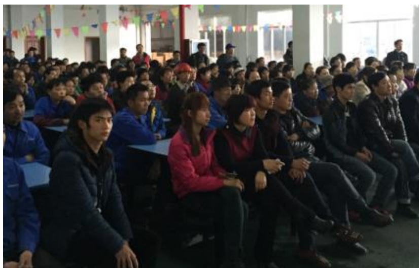
图 2 产品质量培训活动

实现个人和公司整体目标。公司积极与外部进行沟通交流，适时邀请专家对公司员工进行专项培训。公司定期对各级员工开展质量教育，对质量控制点进行专项管理，确保制造过程产品质量的一致性。